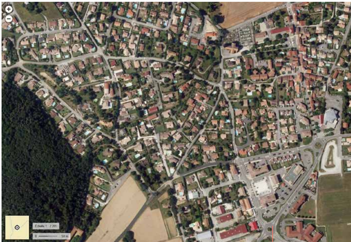
Génissieux vue du ciel

Dans les zones tendues, le foncier disponible est rare et cher, mais la demande reste forte. Ce déséquilibre attire des promoteurs immobiliers qui disposent de