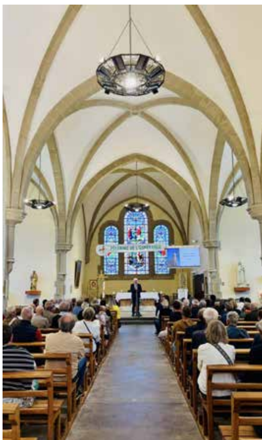
L'intérieur de l'église rénové