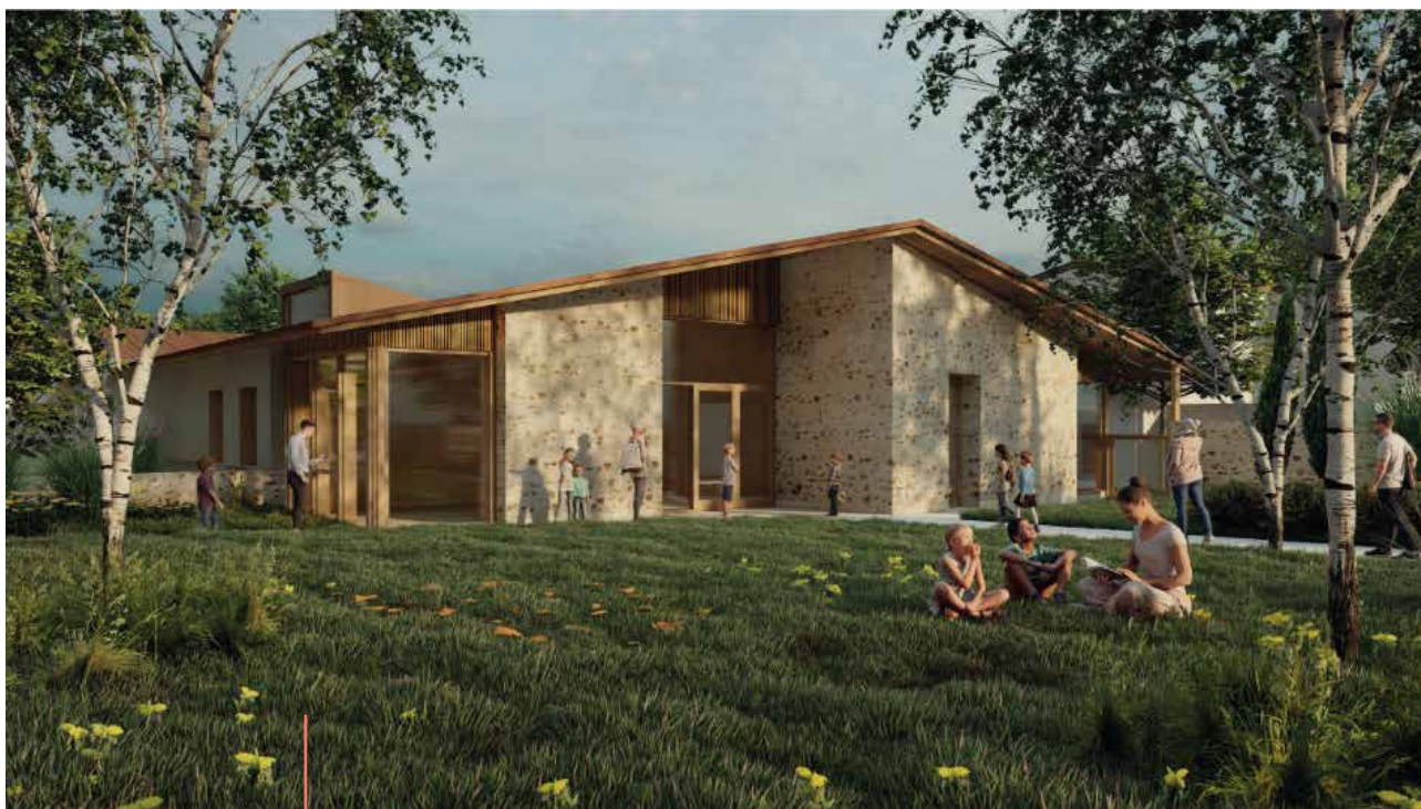
En complément de l'image de l'entrée de l'école en couverture de cette Lucarne, voici une vue paysagère de l'extension à l'arrière de l'école, côté rue des orangers.