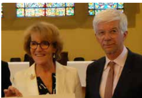
PATRIMOINE Venue du préfet à Génissieux Page 8