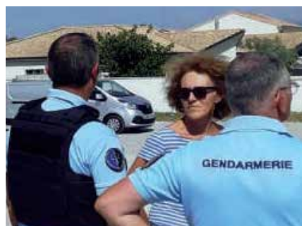
SECURITE La gendarmerie à nos côtés Page 12