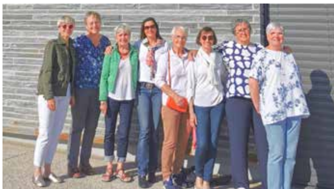
De très actifs membres nommés du CCAS

Les membres du gang des jardiniers et les bénévoles de l'aide aux devoirs, de la bibliothèque ainsi que les membres nommés du CCAS ont été invités à une randonnée galette des rois. Un moment convivial qui rassemble les membres des différentes structures qui font battre le cœur de notre village. N'hésitez pas à contacter la mairie si vous souhaitez participer !