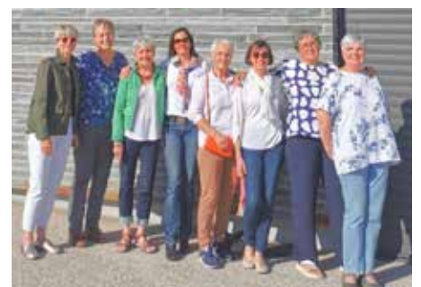
SOCIAL Une équipe CCAS mobilisée Page 23